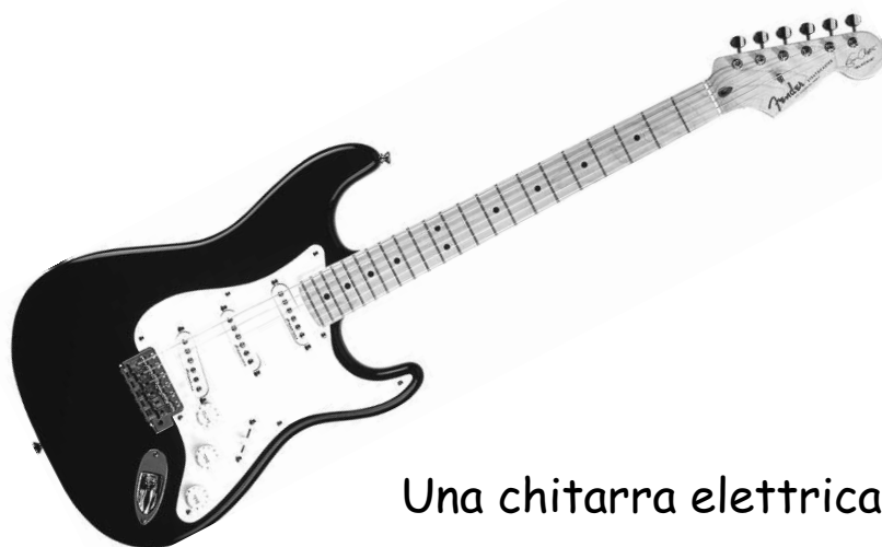
Una chitarra elettrica

Pochi strumenti musicali posseggono la popolarità della chitarra e, facendo un po' di attenzione ai chitarristi che compaiono nei programmi televisivi, scopriremo che non esiste un solo modo per produrre il suono su questo strumento; ora abbiamo gli elementi per iniziare una piccola ricerca e scoprire cosa c'è dietro all'utilizzo dei vari tipi di chitarra.