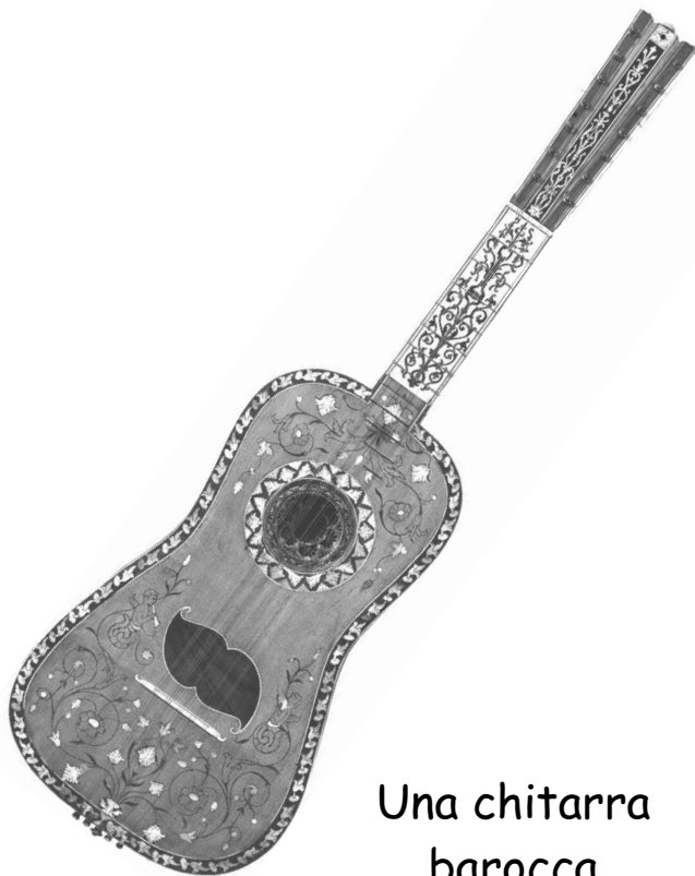
Una chitarra barocca

In un primo momento le corde si presentavano raddoppiate, nel 1700 però i raddoppi furono eliminati e si aggiunse la sesta corda, definendo con questi ultimi ritocchi il modello attualmente in uso.